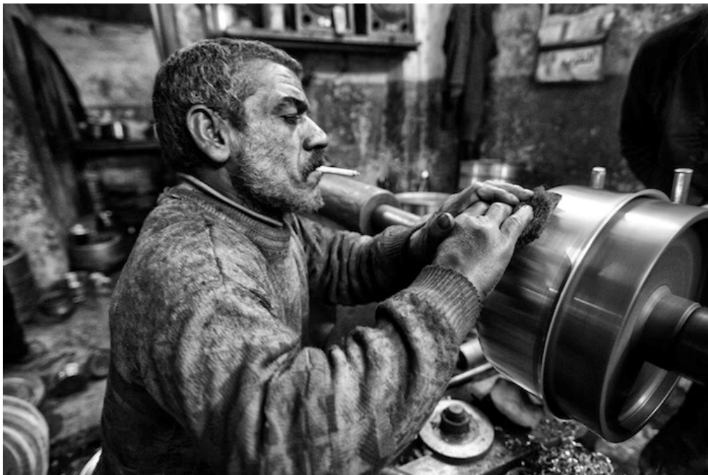
کارگران آلومینیم برای مدت طولانی در یک کارگاه نمی‌مانند. هر شش ماه کارگاه خود را عوض می‌کنند.