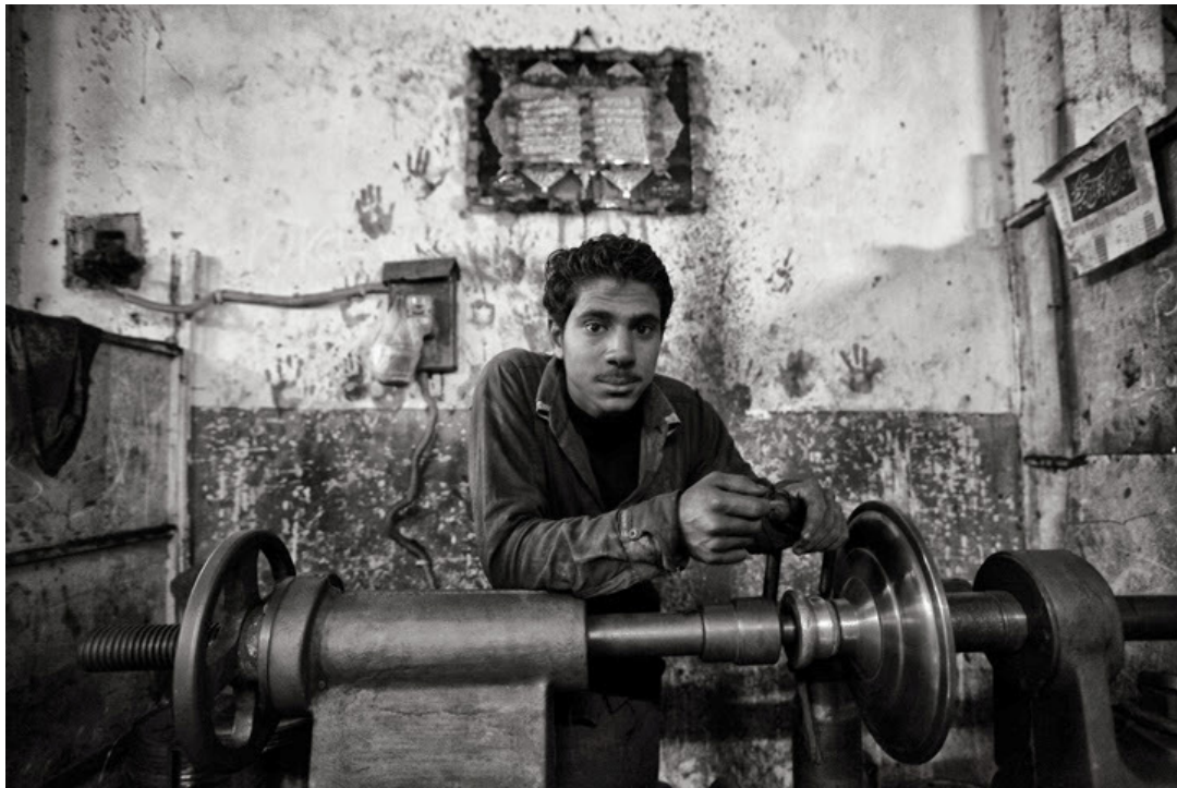
یک کارگر جوان صیقل‌کار در میت‌غمر