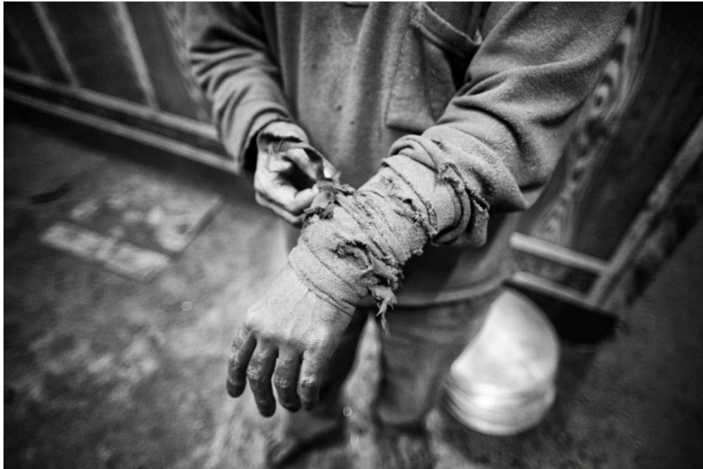
یک کارگر پارچه محافظت از دست‌های‌اش را بعد از یازده ساعت کار مداوم باز می‌کند.