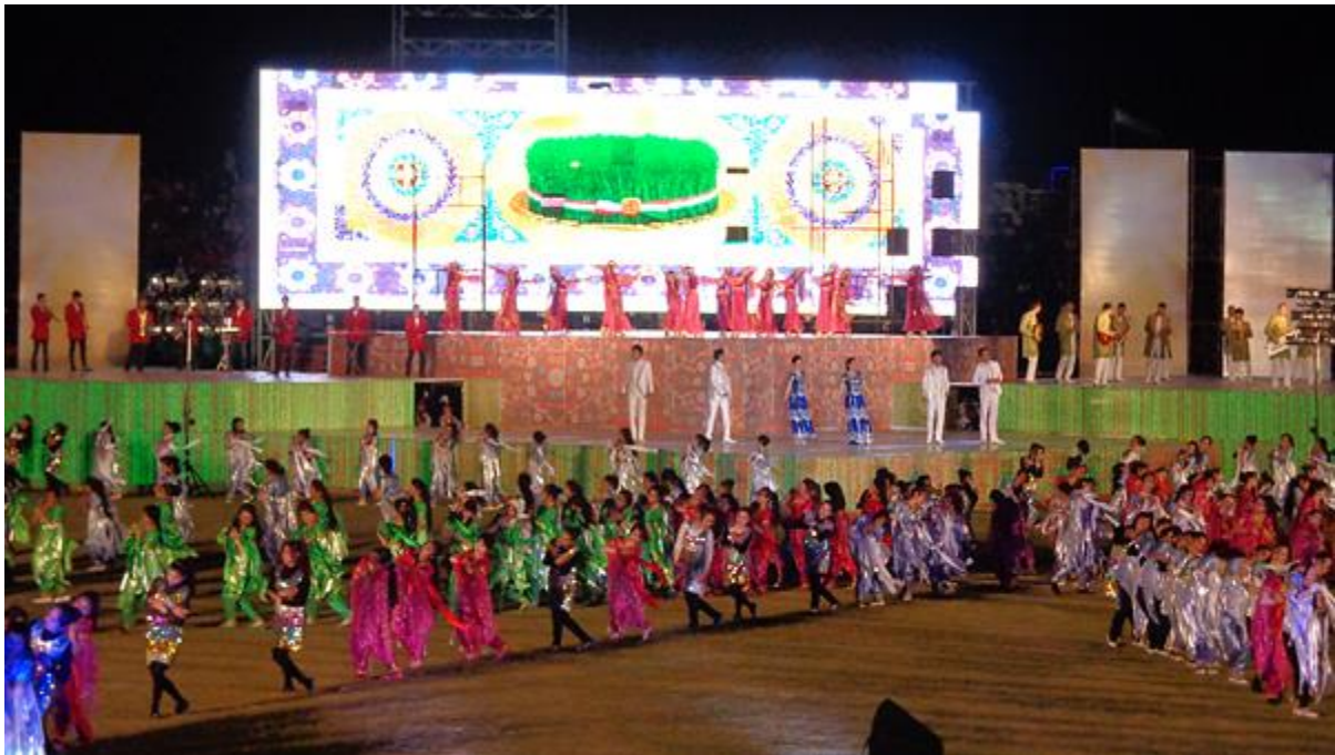
جشن نوروز در خجند