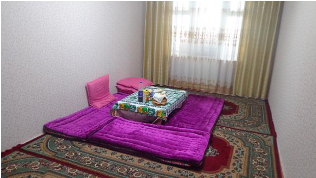
خانه ای در خجند