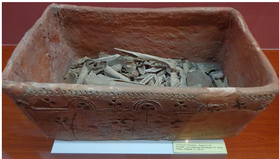
موزه ملی تاجیکستان در دوشنبه