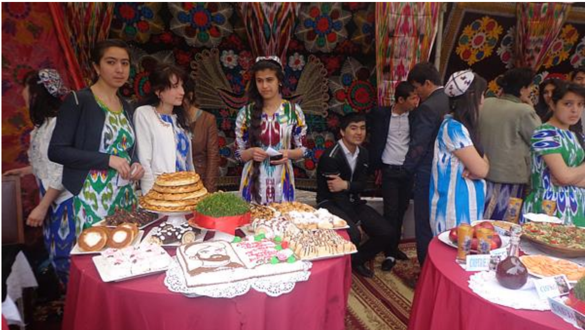
بازارچه نوروزی در خجند