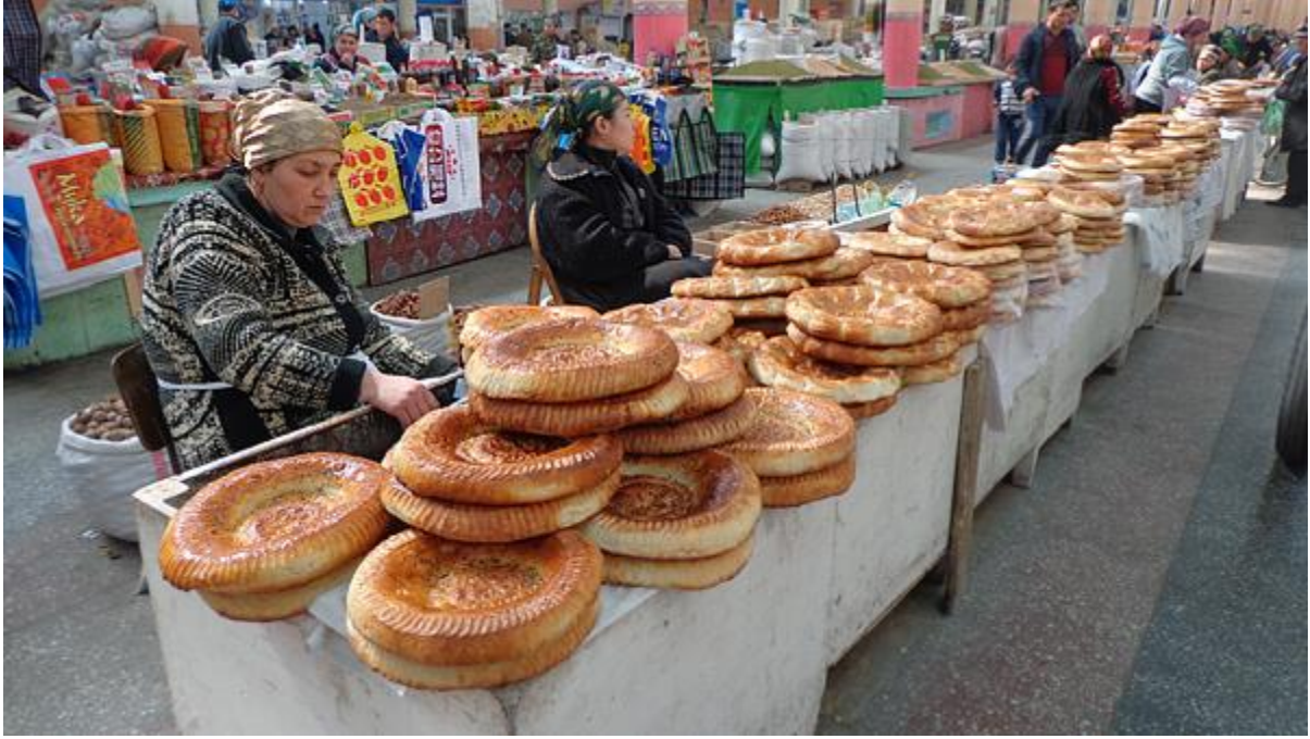
پنجشنبه بازار خجند