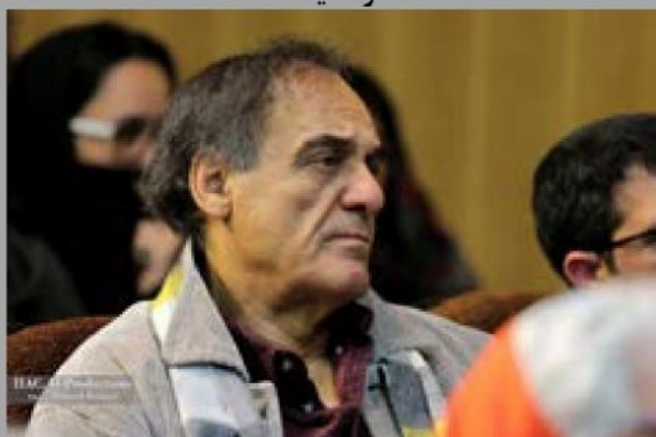
قطب الدین صادقی