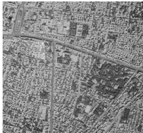
محدوده پارک امین‌الدوله در عکس هوایی سال ۱۳۳۵ خورشیدی

پارک متشکل بود از برکه‌ای مصنوعی با قایق‌هایش، یک عمارت اصلی که شباهت زیادی با عمارت قصر یاقوت داشت، یک کوشک با پلان هشت ضلعی و درختانی که از دو طرف سر به آسمان کشیده بود.