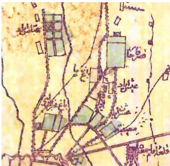
موقعیت باغ امین‌الدوله در محدوده اطراف (کتاب تهران گردی)

در جلد سوم سیاحت‌نامه نویسنده، پارک امین‌الدوله را این‌گونه معرفی می‌کند: تا رسیدیم به در خانه‌ی بزرگی که شکوه آن نمونه‌ای از عظمت صاحب‌خانه بود. از در داخل شدیم. دیدم باغچه‌ی بسیار مزینی است مشحون به انواع گل‌های رنگارنگ. جمعیتی از خدم و حشم هریک به کار خود مشغول و کسی را با کسی کاری نیست. از پله‌ها بالا شده به طبقه‌ی دوم عمارت رسیده و از تالار بزرگی گذشتیم... (امینی، علی، ۱۳۵۴:۳۰) مرحوم امین‌الدوله مردی بود در کمال ذوق. در تهران پارک وسیعی ساخت و قناتی