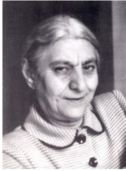
تصویری از چهره فخرالدوله