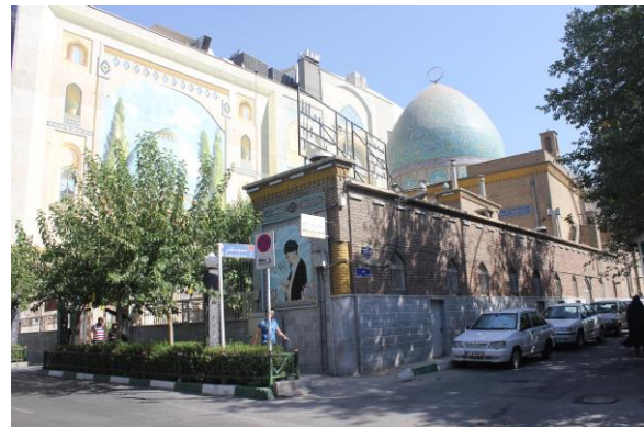
نمایی از مسجد فخر و مجتمع نوساز تجاری

به خیابان مجاور دید دارد. گنبدخانه در شمال صحن قرار گرفته و شرق و غرب صحن به دو رواق اختصاص دارند. مأذنه مسجد از داخل صحن دید ندارد و در خارج از مکعب ساختمان اصلی در کنار کوچه‌ی مجاور مسجد قرار گرفته است. مأذنه در جایی قرار گرفته که می‌توان آن را از طرح حذف کرد و شاید این مأذنه در طرح اولیه وجود نداشته و بعداً به طرح اضافه شده است...» (مختاری، ۱۳۹۰: ۸۷)