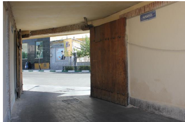
نمایی از درب ورودی پارک امین‌الدوله

مرحوم امین‌الدوله دوران اول زندگی را با توجه چنان پدری پرورش یافت. در پانزده سالگی منشی وزارت خارجه شد. در سال ۱۲۷۸ هجری قمری که هجده ساله بود خط و ربطش توجه ناصرالدین شاه را جلب کرد و شاه دستور داد در سفر و حضر ملتزم رکاب باشد. در نوزده سالگی به نیابت اول وزارت امور خارجه رسید و بیست و سه ساله بود که به سمت منشی مخصوص شاه انتخاب شد. (امینی، علی، ۱۳۵۴:۵)