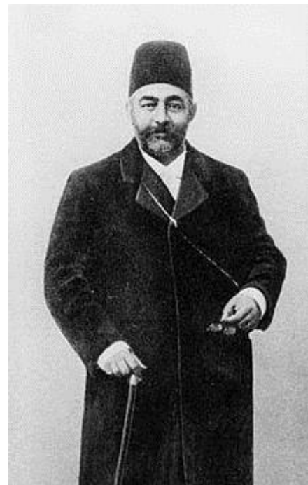
تصویری از علی‌خان امین‌الدوله، صدراعظم مظفرالدین شاه قاجار (مرکز)

مرحوم میرزا علی‌خان امین‌الدوله به سال ۱۲۶۰ هجری قمری در تهران متولد شد. پدرش میرزا محمدخان مجدالملک سینکی لواسانی از رجال دوران ناصری است. (امینی، علی، ۱۳۵۴:۴)