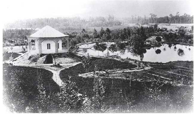
نمایی از باغ امین الدوله و برکه پارک