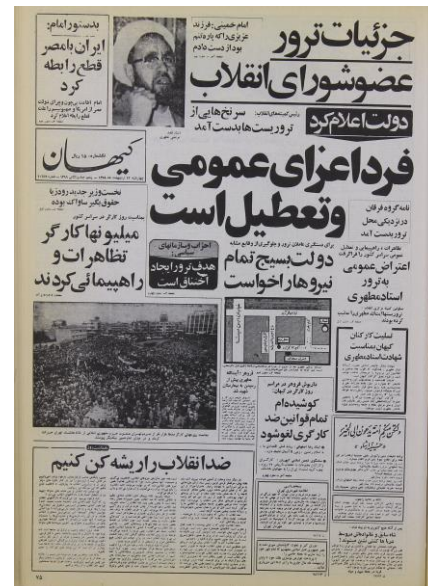
ترور استاد مطهری (کیهان، ۱۳۵۸:۱)

فاصله نسل امروز و نسل دیروز بیش از پیش در حال افزایش است. این موضوع در جامعه ایران، متأثر از شرایط خاص و تحولات اجتماعی-سیاسی ناشی از وقوع انقلاب اسلامی نمود بارزتری یافته است. راهکارهای متنوعی برای کاهش فاصله بین