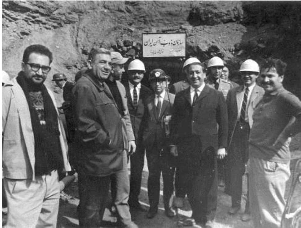
تونل شماره ۴ معدن پابدانا - تحت نظارت و شناسایی سازمان ذوب آهن