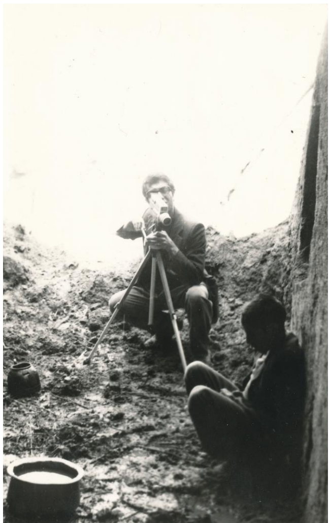
زیر طاق های کاهگلی